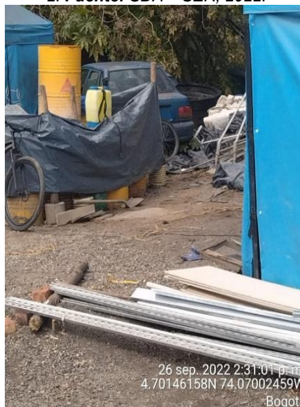
Fotografía 53. Intervención denominada campamento 2.