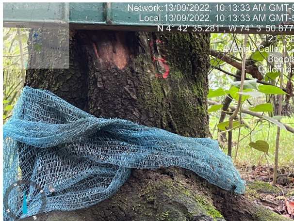
Fotografía 4. Afectación de individuo arbóreo por la estructura denominada estructura metálica.