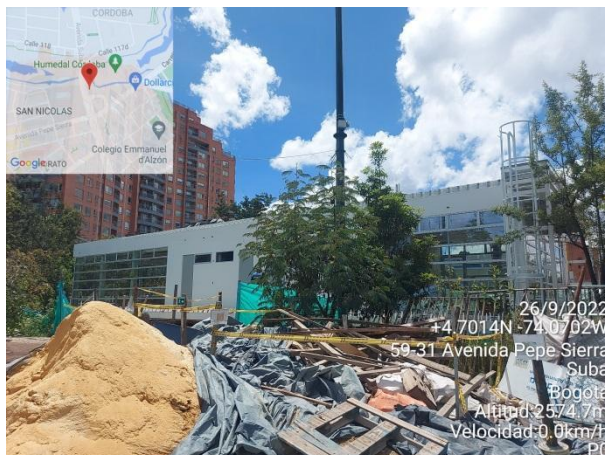
Fotografía 51. Intervención denominada campamento 2.