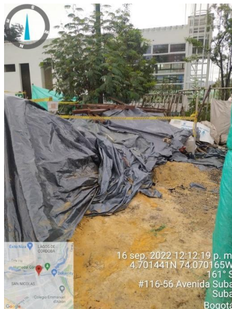
Fotografía 55. Intervención denominada campamento 2.