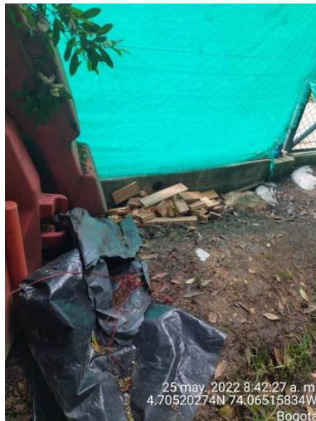
Fotografía 47. Intervención denominada campamento 1.