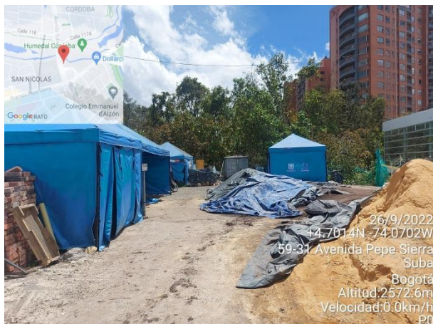
Fotografía 50. Intervención denominada campamento 2.