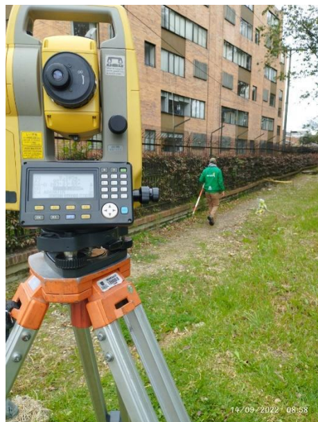
Fotografía 41. Intervención denominada zona adoquín levantado