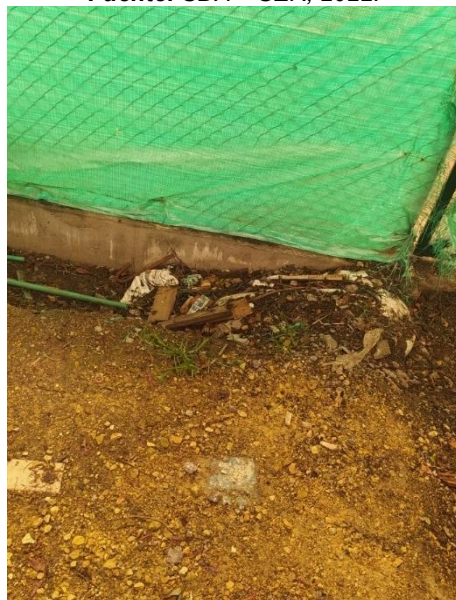
Fotografía 49. Intervención denominada campamento 1.