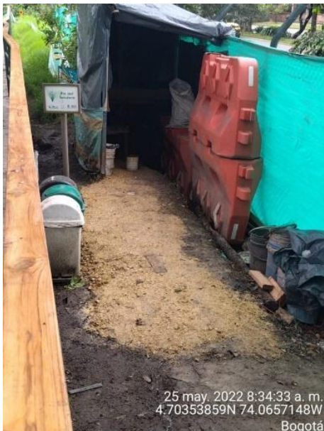
Fotografía 46. Intervención denominada campamento 1. Fuente: SDA – SER, 2022.