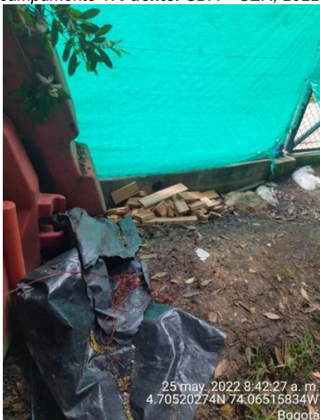
Fotografía 48. Intervención denominada campamento 1.