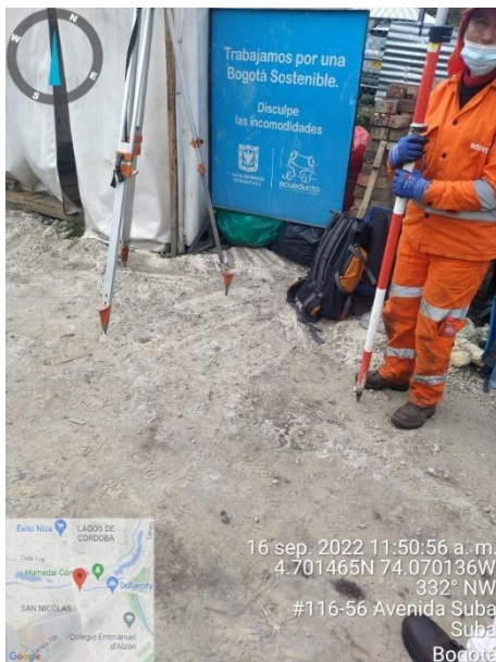
Fotografía 54. Intervención denominada campamento 2.