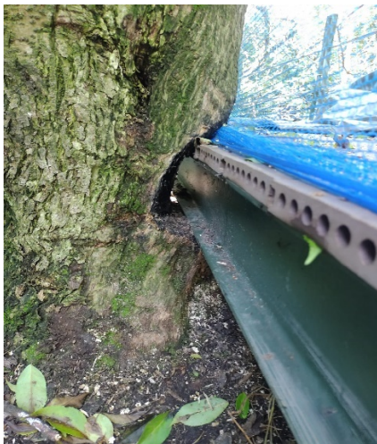
Fotografía 3. Afectación de individuo arbóreo por la estructura denominada estructura metálica.