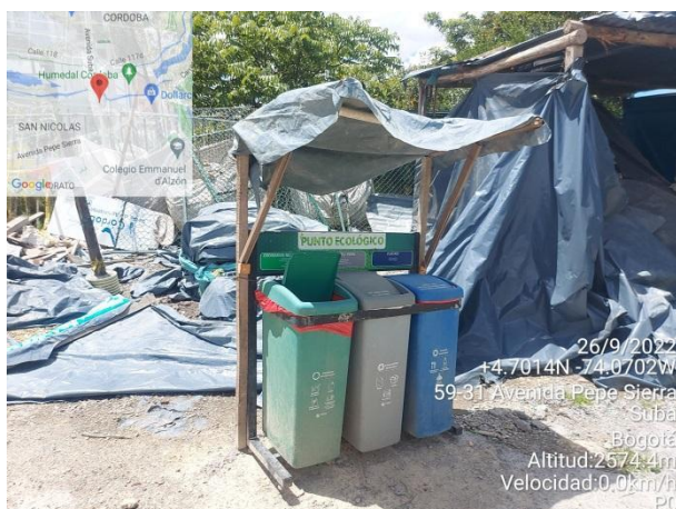
Fotografía 52. Intervención denominada campamento 2. Fuente: SDA – SER, 2022.